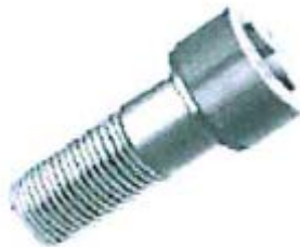
六角穴付ボルト (生地)